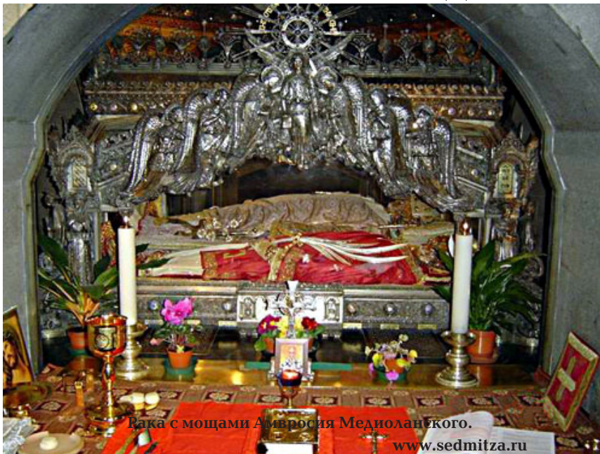
Рака с мощами Амвросия Медиоланского.

Святитель Амвросий, епископ Медиоланский, родился в 340 году в семье римского наместника Галлии. Еще в детстве святителя были явлены чудесные предзнаменования его великого будущего. Так, однажды пчелы покрыли лицо спящего младенца и улетели